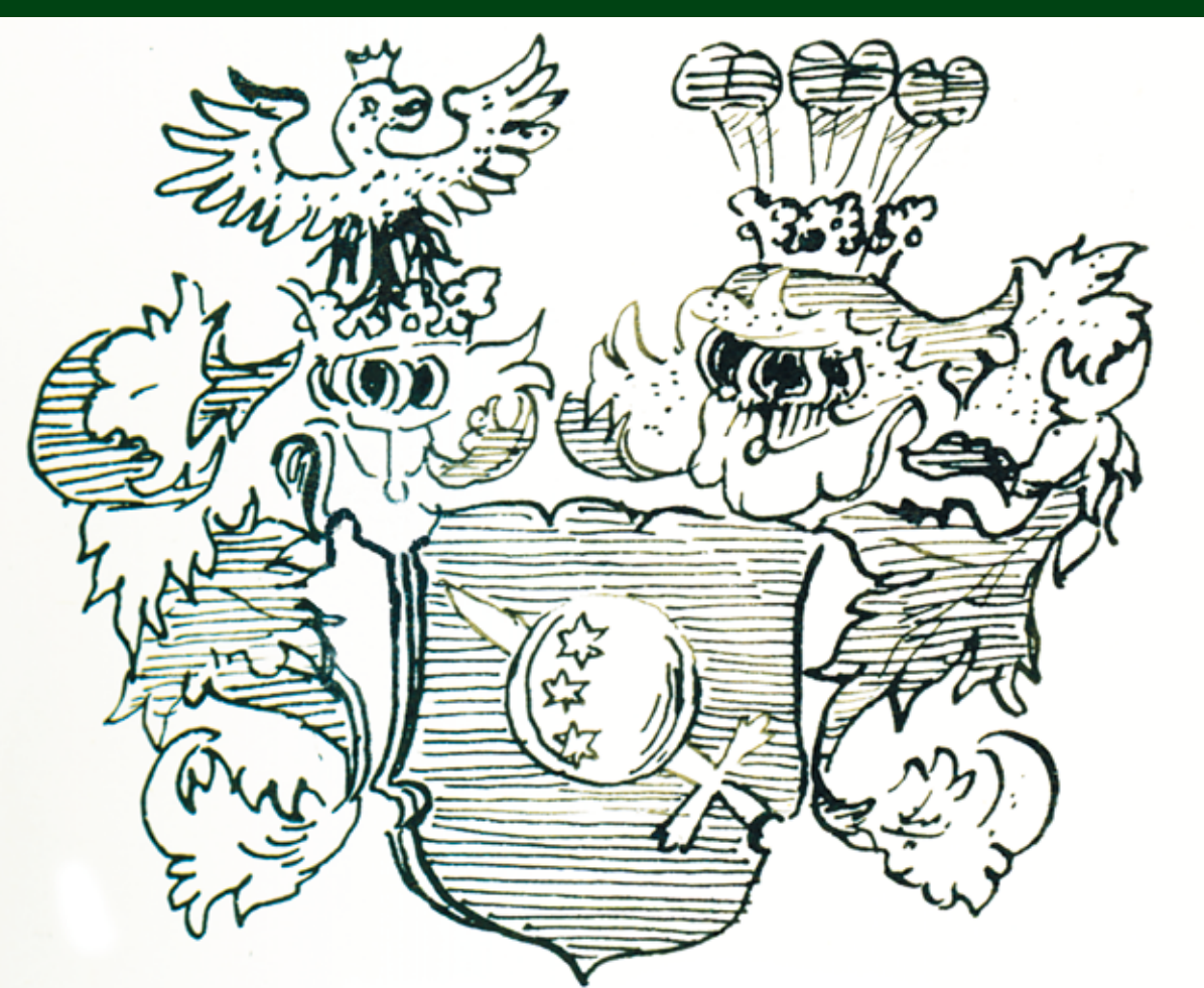
Erb Korbů z Weidenheimu. Kresba: Karel Polák. / Wappen der Familie Korb von Weidenheim. Zeichnung: Karel Polák.