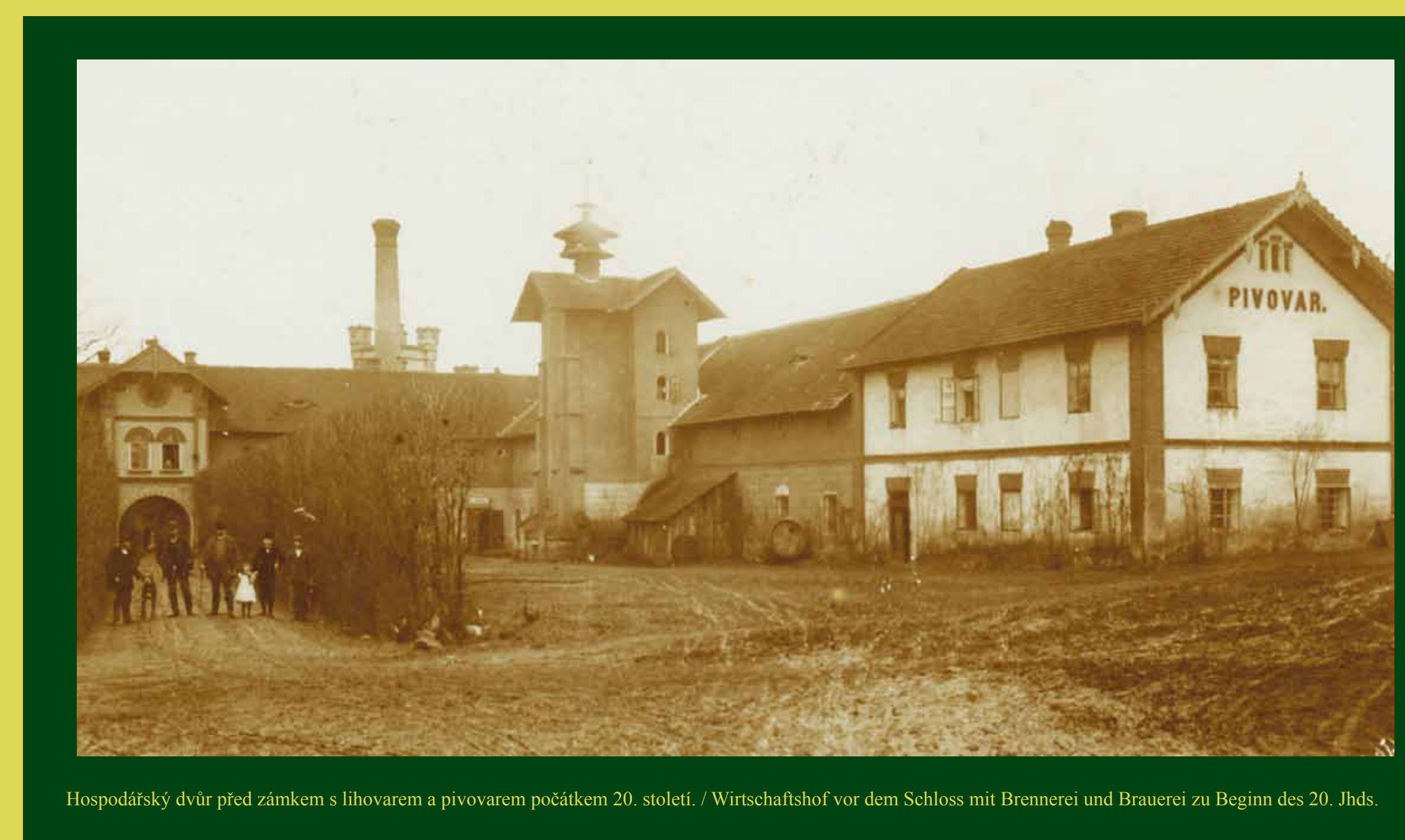
Hospodářský dvůr před zámek s lihovarem a pivovarem počátkem 20. století. / Wirtschaftshof vor dem Schloss mit Brennerei und Brauerei zu Beginn des 20. Jhds.